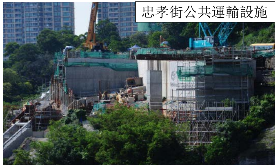
忠孝街公共運輸設施