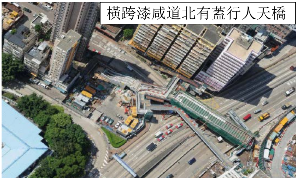
橫跨漆咸道北有蓋行人天橋