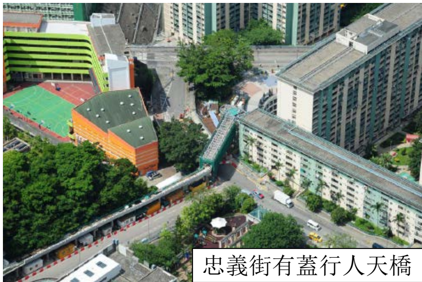
忠義街有蓋行人天橋