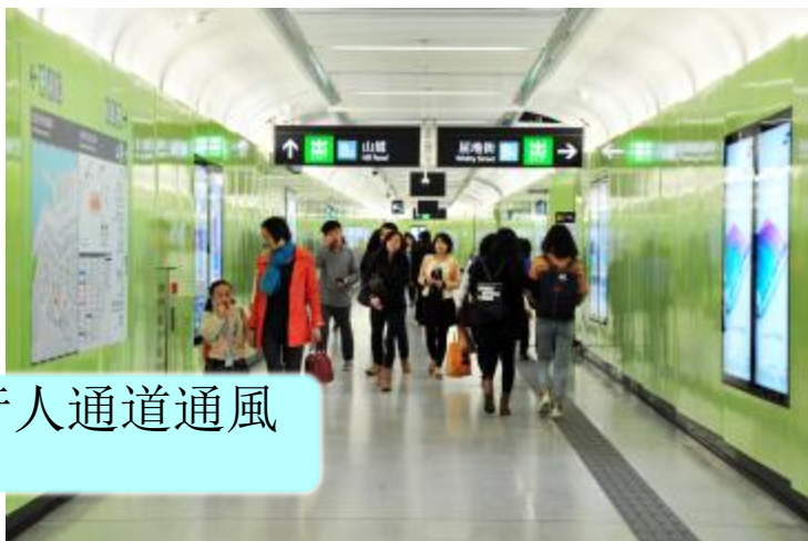
加強行人通道通風