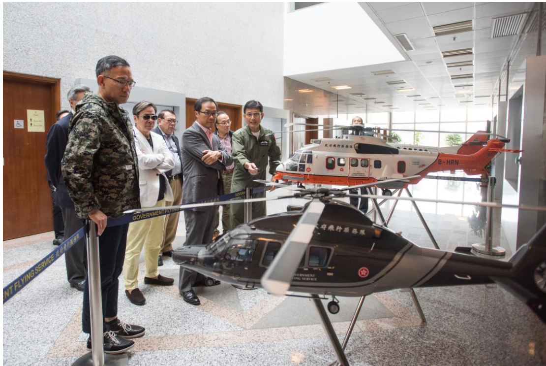
立法會議員參觀政府飛行服務隊。