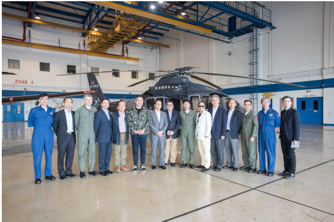
立法會議員與審計署署長孫德基（右五），以及政府飛行服務隊代表在飛機庫合照。出席的議員包括石禮謙議員（右八）、謝偉俊議員（左六）、梁家傑議員（左五）、黃毓民議員（右六）和梁繼昌議員（左七）。