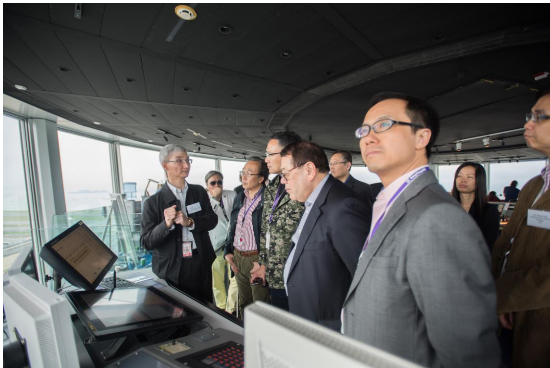
立法會議員參觀民航處航空交通控制塔。