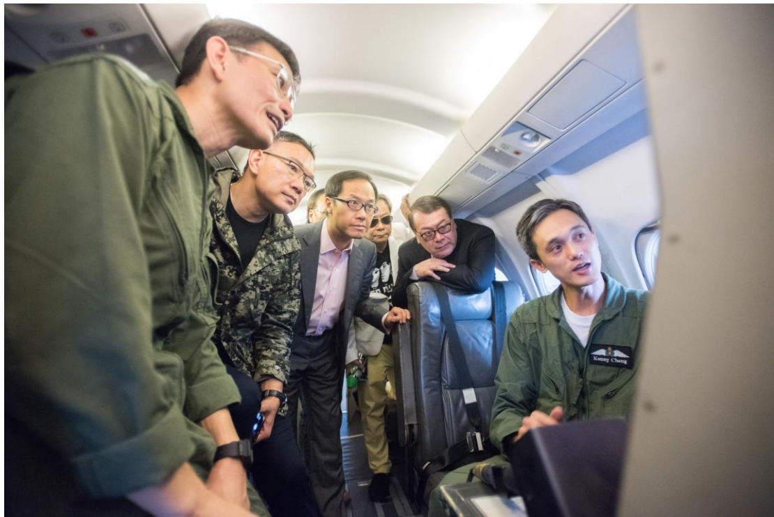
立法會議員登上飛行服務隊的定翼機，以了解其操作。