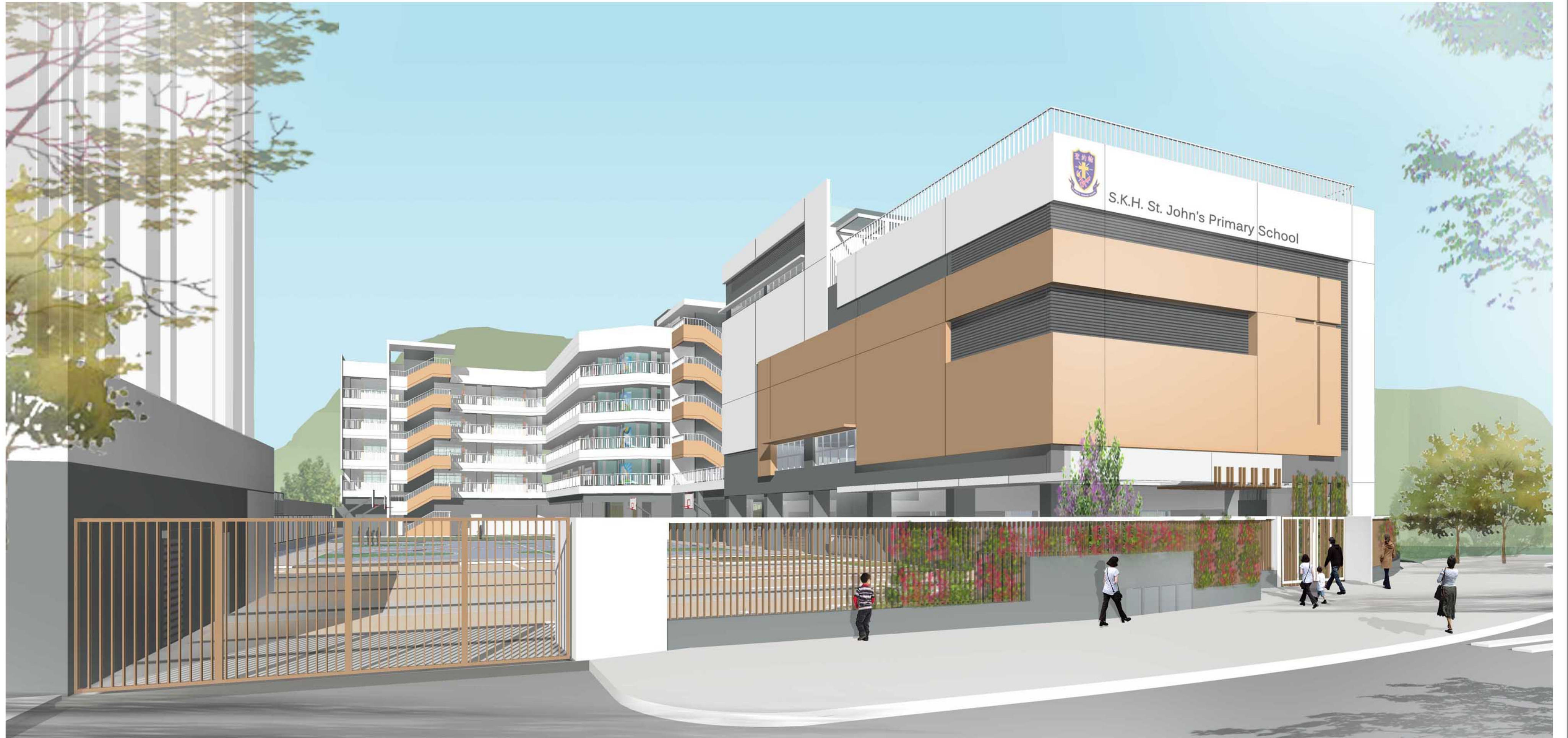
從安翠街望向小學的構思圖 PERSPECTIVE VIEW FROM ON CHUI STREET