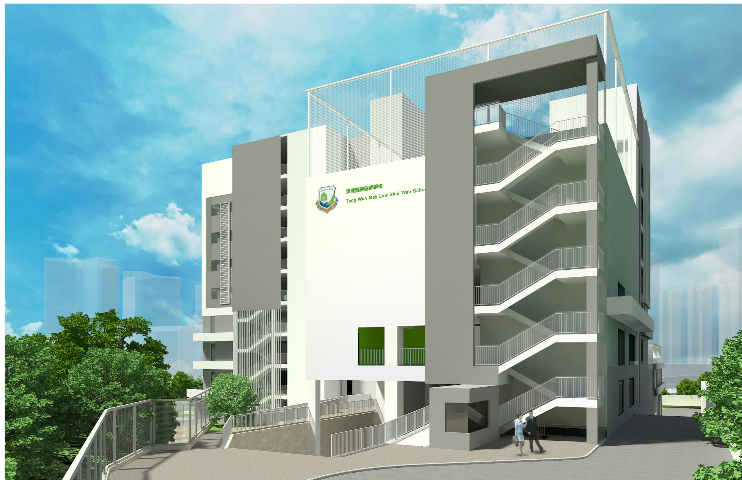
PERSPECTIVE VIEW FROM SOUTH WESTERN DIRECTION 從西南面望向學校的構思透視圖