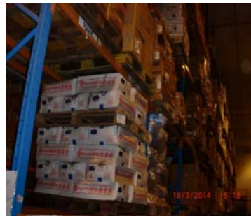
進口商倉庫 (適用於冷凍或冷藏食物)