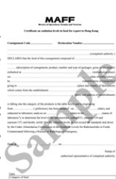
輻射水平證書樣本