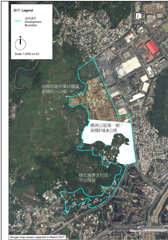
圖一：改善棕地作業試驗區