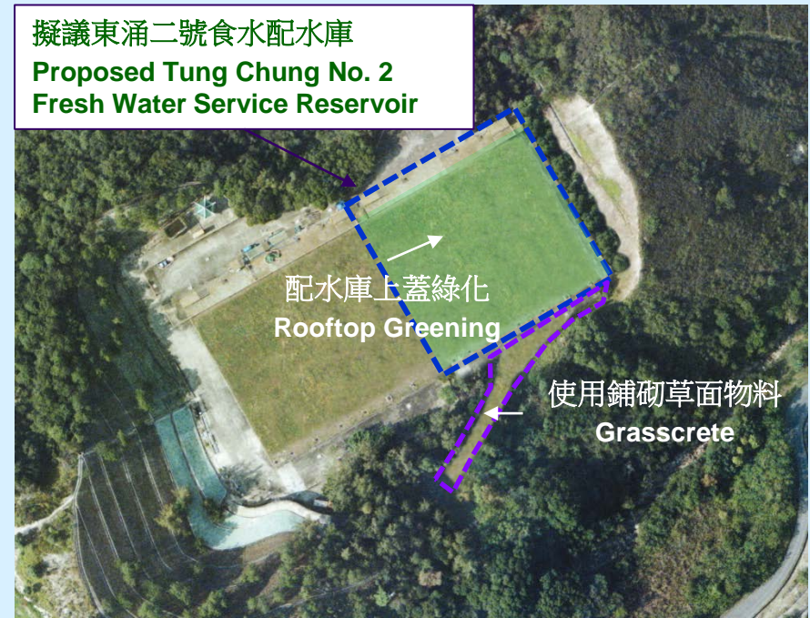
高空景觀 Aerial View