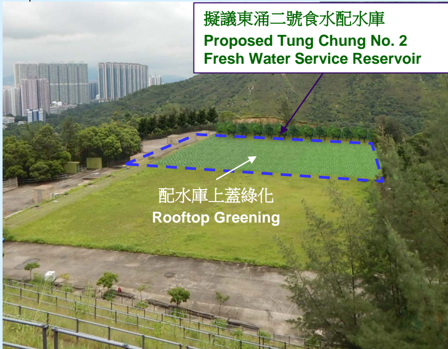
東涌食水配水庫現址的景觀 View from Existing Tung Chung Fresh Water Service Reservoir