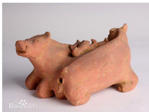
廣東出土西漢陶牛 父母與 4 幼牛 嬉戲，顯示古代人已了解牛重視家