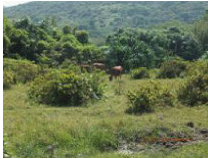
大嶼山牛隻原居地草原生態及遮蔽地，原生林及肥沃草地、水源