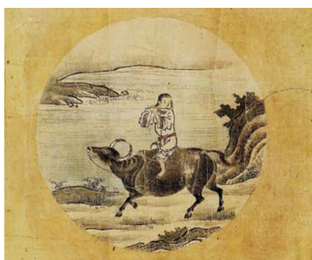
唐朝普明禪師牧牛圖，人牛關係 十分密切，更以牛喻禪理，代表