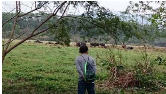
牛踏足的草原會較鬆軟，適合動植物 依存棲息