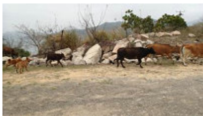
狗隻追趕牛群，飽受驚嚇。