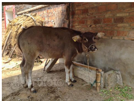
耕牛雖然辛苦，但仍有擋風雨和歇息的牛棚