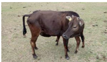
幼牛因到水上活動中心飲水而被魚钩刺入舌中