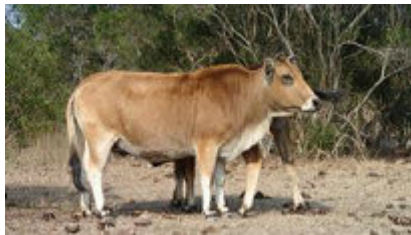
成長牛追著母牛飲奶