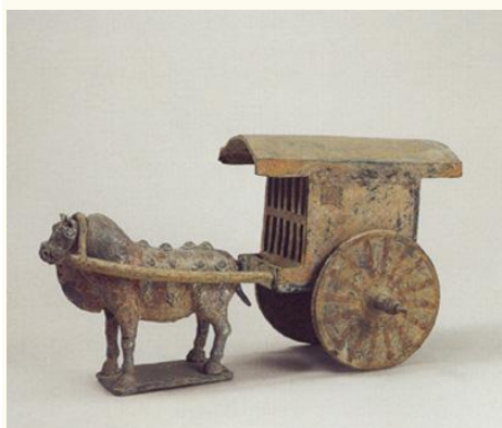
南北朝陶牛車，洛陽出土

1. 黃牛是中國人最早的工作夥伴，中國有農耕社會便有黃牛協助耕作的紀錄，陶牛出現於南北朝，距今有 4000 多年，香港的考古發現亦於相近時期出土的李鄭屋古墓及陶製房屋，亦印證了農耕社會於 2000 多年前已出現於本土，並飼養牲畜如狗、牛等協助生活。可知牛隻在香港為農耕社會一份子。至宋、明、清三朝近一千年間，中原氏族相承繼南遷，香港農耕面積愈大，耕牛成為重要的牲畜，並和先民建立密切的關係。