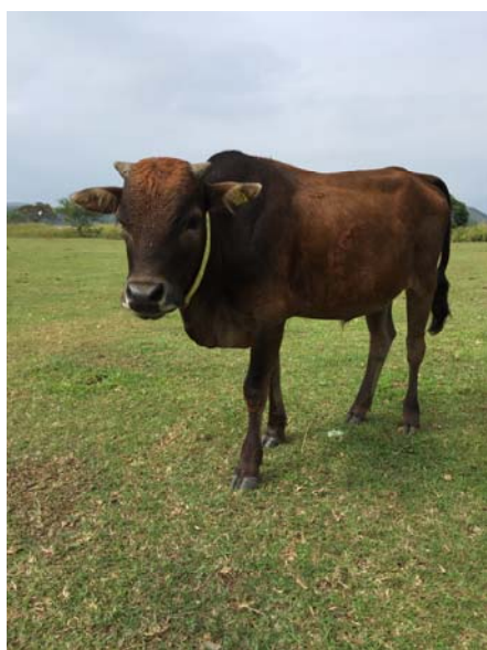
幼牛 715 孤獨在創興