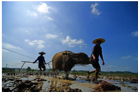
香港最後的耕牛在半世紀前才消失