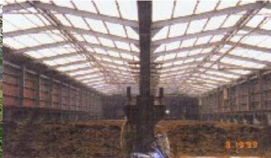
台灣的大型牛糞堆肥工場，提供龐大 經濟效益

牛在生物鏈是重要一環，耕牛以前可耕作大片農地，而人就依賴農地生活。沒有農地耕作，但耕牛可以說是清除野草的天然工具，郊野漫草叢生，正好代替昂貴的人力。此外，牛踏竹的草原會鬆軟，適合動植物依存棲息，牛糞是最好的有機肥，現代科學已可將牛糞提煉為蚊香(香港)、牙膏(印度)、發電.....經濟和生態效用無窮。