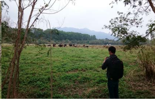
香港一般村落的牛草大黍(俗稱芒箕)