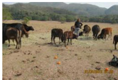
創興水上活動中心，草地呈沙石質