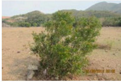
創興水上活動中心，草亦難以生長，亦無大樹林供遮蔽