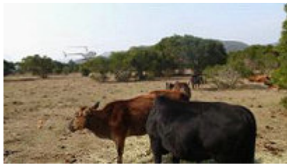
到訪當日， 有直升機在牛群不足 100 米範圍升降，令牛群飽受驚嚇