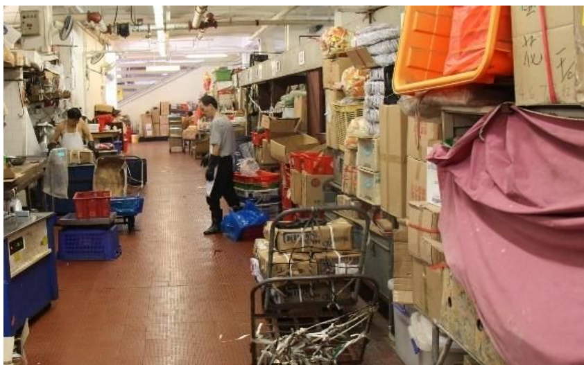
筲箕灣街市 - 拍攝日期及時間：2016年8月25日 下午3時10分 *實際營運率(14%)與政府公布出租率(100%)相差甚遠 *大部份出租檔位及空置檔位均放置大量雜物

107動力 取名自基本法107條，以減少稅金、善用公帑和簡政便民為宗旨，要求政府財政量入為出。