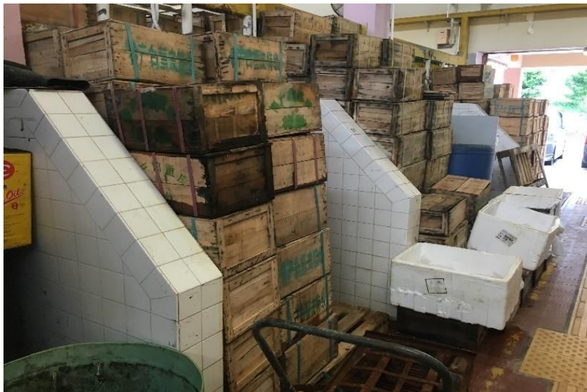
對面海街市 - 拍攝日期及時間：2016年8月28日 下午4時40分 *實際營運率(0%)與政府公布出租率(100%)有天淵之別 *整個街市沒營運，全部檔位也存放大量雜物