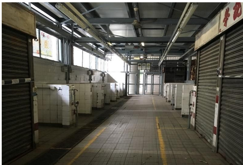
通州街臨時街市 - 拍攝日期及時間：2016年9月12日 下午3時

針對實際營運率，107動力於 2016 年 7 月底至 8 月進行一項「公營街市調查及研究」，派調查員於買餸高峰時段到港、九、新界及離島 18 區共 40 個街市進行實地視察及統計，包括 35 個食環街市及 5 個房委會整體承租方式出租的街市。研究發現食物環境衛生署轄下的公營街市實際營運率平均僅得 3 成多，更有街市出現「零營運」情況。實際營運率與政府公布出租率的數字相差甚遠。