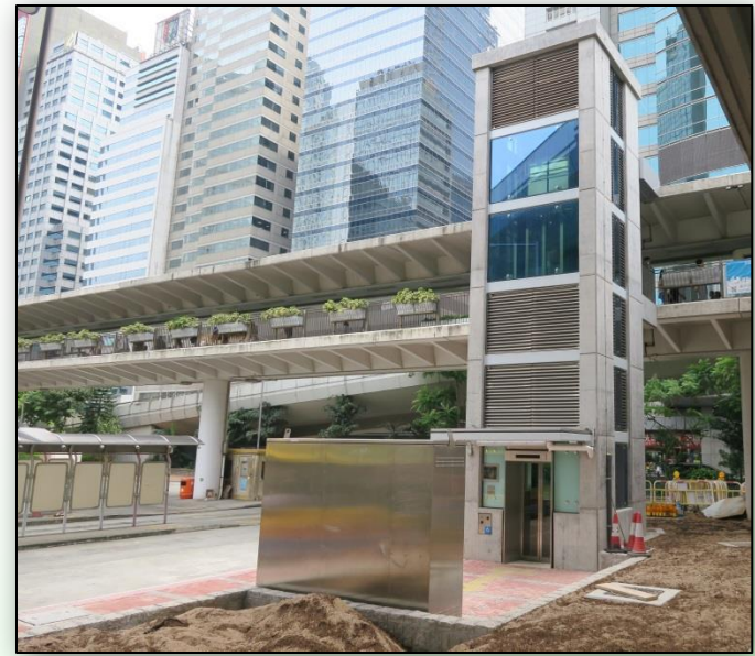
採用機械通風設計的升降機