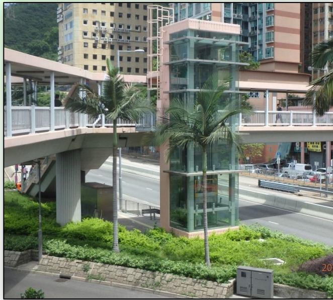
採用空調設計的升降機