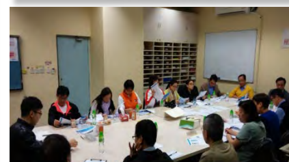
居民聯絡小組會議