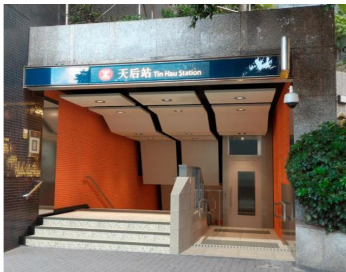
天后站B出入口加設垂直升降台