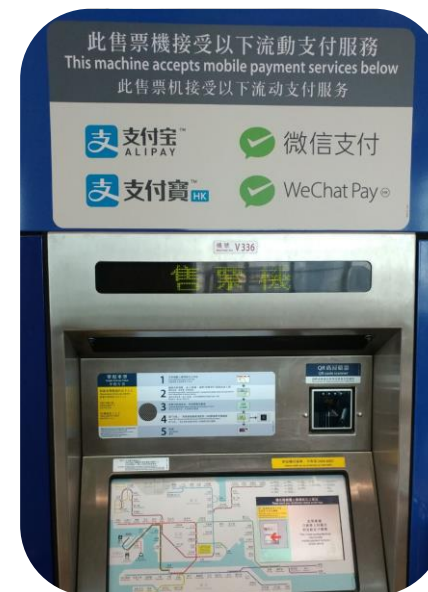
試行支援流動支付服務的售票機