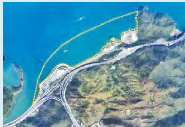
欣澳擬議填海位置