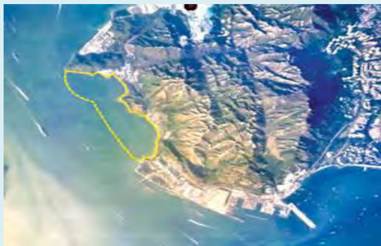
龍鼓灘擬議填海位置

註：小蠔灣填海是一個小規模道路工程項目，主要是興建一條與北大嶼山公路平行的新高速公路