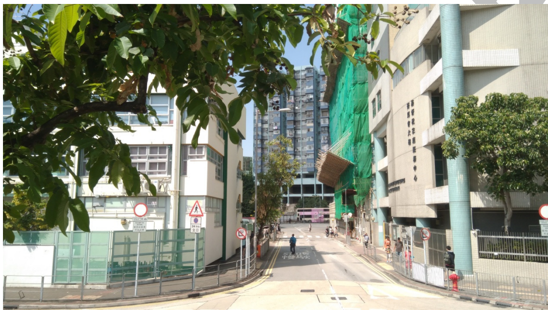
此圖為連接展亮與翠屏道之雙程路。後面為巴士總站。

雖然政府沒有提供公務員學院預計每日使用人數，因預期此學院或會招待國家重要人物來訪或舉辦講座等會提升政要保安級別。但明顯地此路並不能同時滿足公共運輸、公務員學院、興建中的大樓及一般市民日常進出的使用。故在公務員學院地下設有專用車道及泊車間是必然做的事。但無論出口要接駁那一條路，翠屏道或觀塘道都是有問題需要解決。因為本身觀塘已經多車，再加上要成為第二個核心商業區，人流車流大大增加，再加上要消化公務員學院產生的車流，並非一件易事。