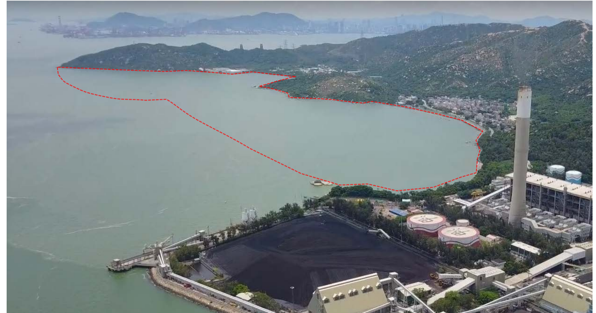
龍鼓灘 – 擬議填海範圍