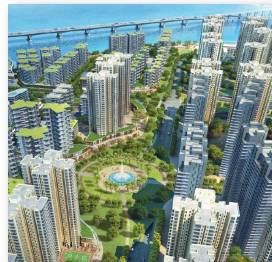
(例子: 東涌新市鎮擴展)