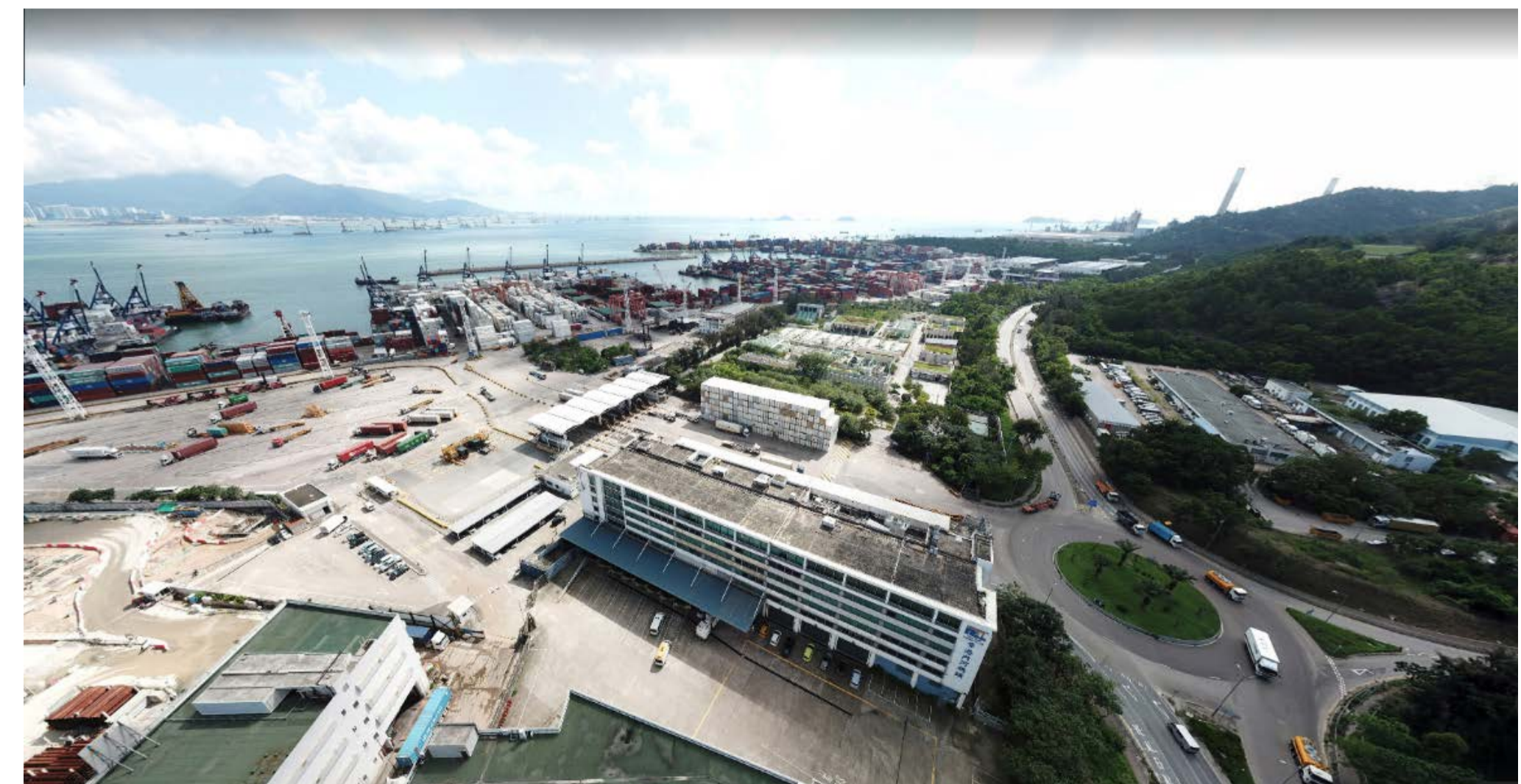
屯門西地區 – 香港內河碼頭