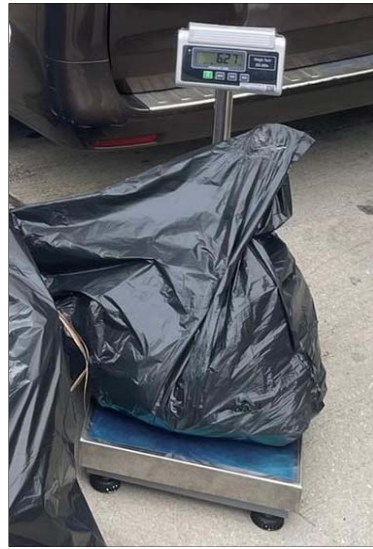
圖中顯示承辦商使用座地感重裝置進行量度收集到的沿岸垃圾數量