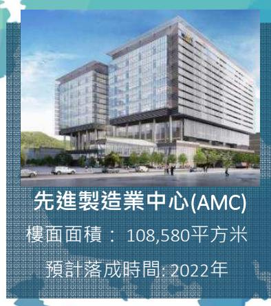
先進製造業中心(AMC) 樓面面積：108,580平方米 預計落成時間：2022年