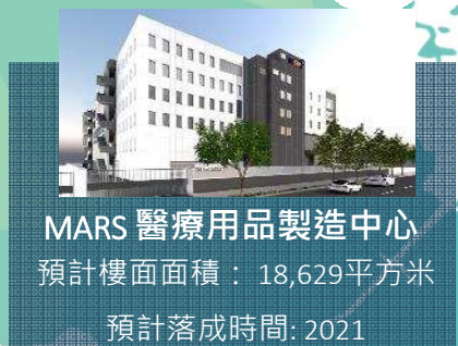
MARS 醫療用品製造中心 預計樓面面積：18,629平方米 預計落成時間：2021