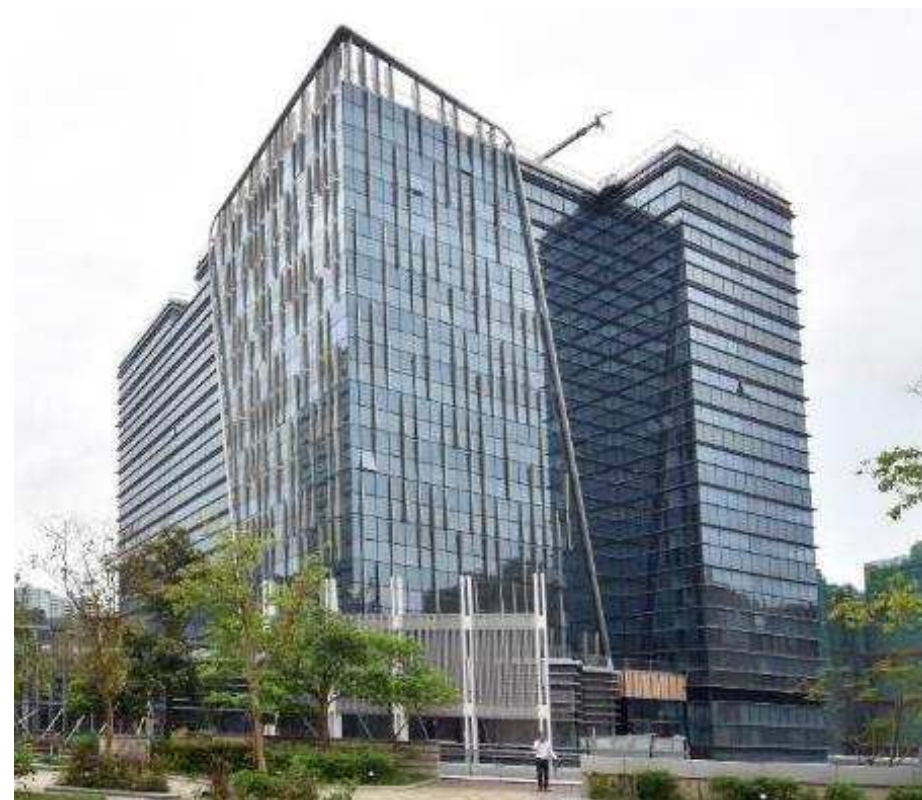
環球研發基地 香港科學園 17W 及 19W大廈

政府提供財政支援：資金、營運、研究 非財政支援：科研設施、人才招聘、業務發展和市場營銷等