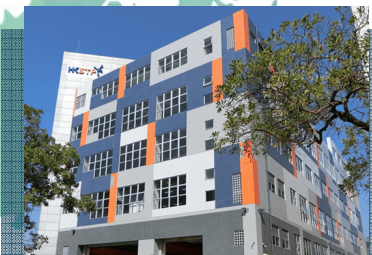
精密製造中心(PMC) 樓面面積：8,494平方米 落成時間：2018年