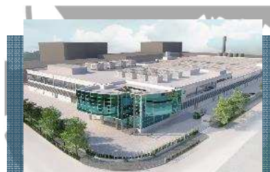
微電子中心(MEC) 預計樓面面積：36,180平方米 預計落成時間：2023年