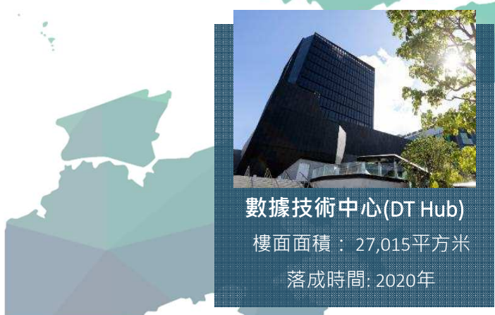
數據技術中心(DT Hub) 樓面面積：27,015平方米 落成時間：2020年