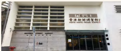
香港新聞博覽館 (必列啫士街街市)