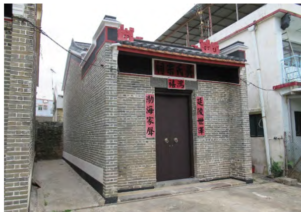
吳氏宗祠 (三級歷史建築)