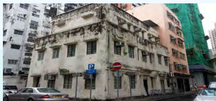
大坑火龍文化館 (書館街12號)