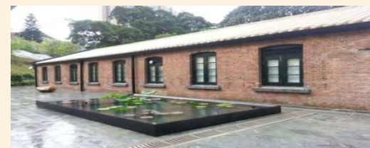
饒宗頤文化館 (前荔枝角醫院)