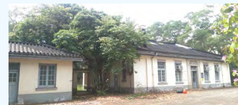
何東夫人醫局・生態研習中心 (何東夫人醫局)