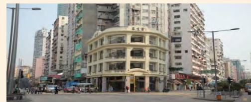
香港浸會大學中醫藥學院－雷生春堂 (雷生春)