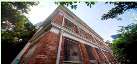
羅拔時樓開心藝展中心 (舊域多利軍營羅拔時樓)