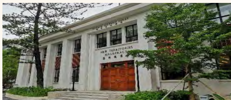
香港青年協會領袖學院 (前粉嶺裁判法院)