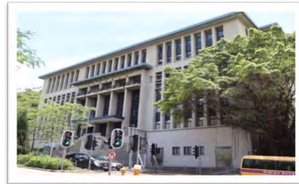
前北九龍裁判法院