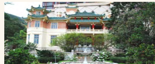
虎豹樂圃 (虎豹別墅)