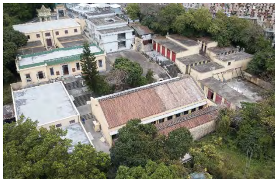
香港薄扶林大口環道 東華義莊