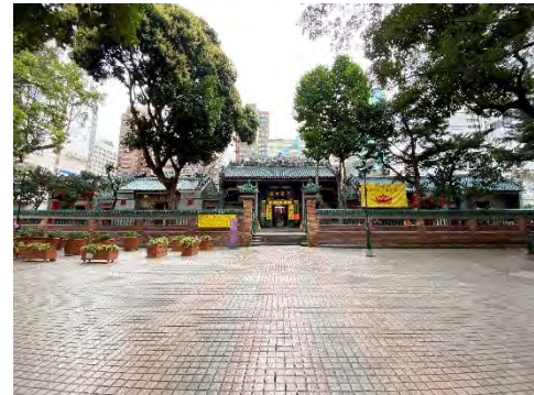
九龍油麻地天后古廟 及其鄰接建築物