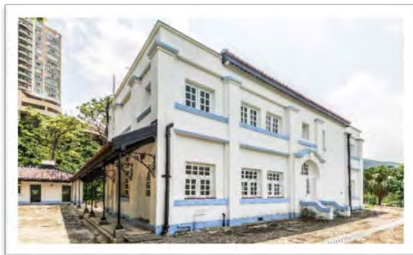
大潭篤原水抽水站員工宿舍群