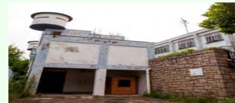
前流浮山警署－ 香港導盲犬學院 (前流浮山警署)