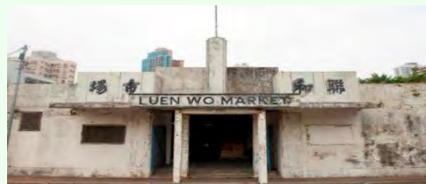
聯和市場－城鄉生活館 (聯和市場)