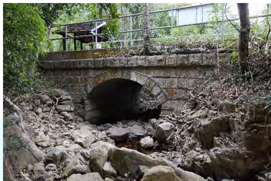
香港薄扶林薄扶林 水塘石橋