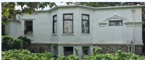
薄島林牧場 (舊牛奶公司高級職員宿舍)