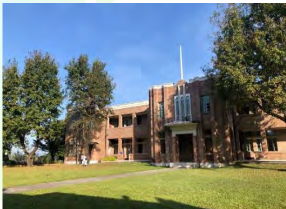
三育書院行政樓 (二級歷史建築)