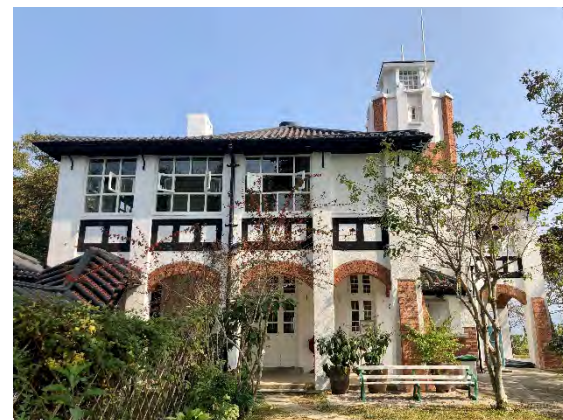
前政務司官邸 (法定古蹟)