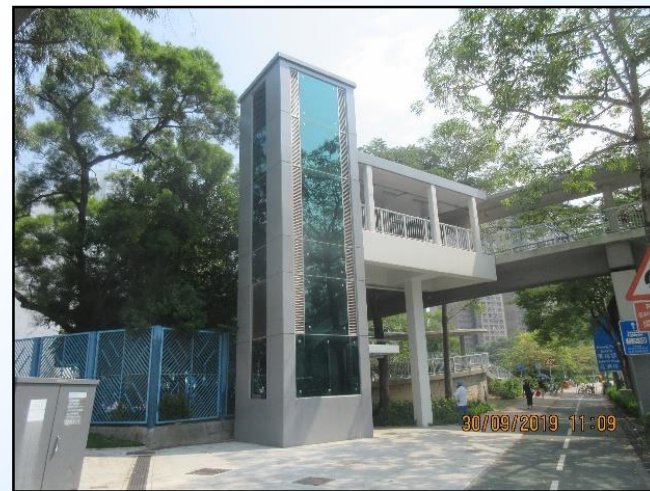
NF156-橫跨大埔公路— 元洲仔段近廣福邨的行人天橋