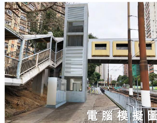
電腦模擬圖 NF94-橫跨鳴琴路 近山景邨景華樓的行人天橋