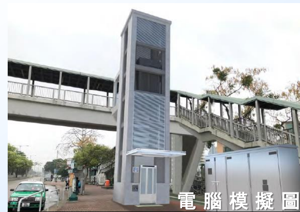
電腦模擬圖 NF150-橫跨青山公路 - 藍地段近泥圍輕鐵站的行人天橋