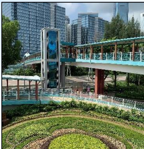
HF92-橫跨東區走廊近 鰂魚涌公園的行人天橋