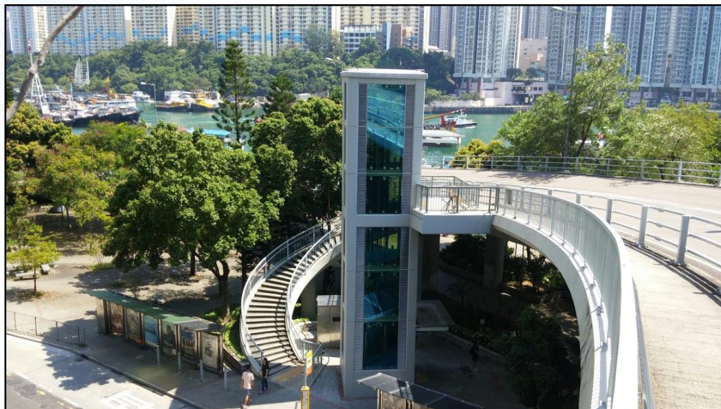
H186-連接南區田灣海旁道及田灣山道的高架行人道