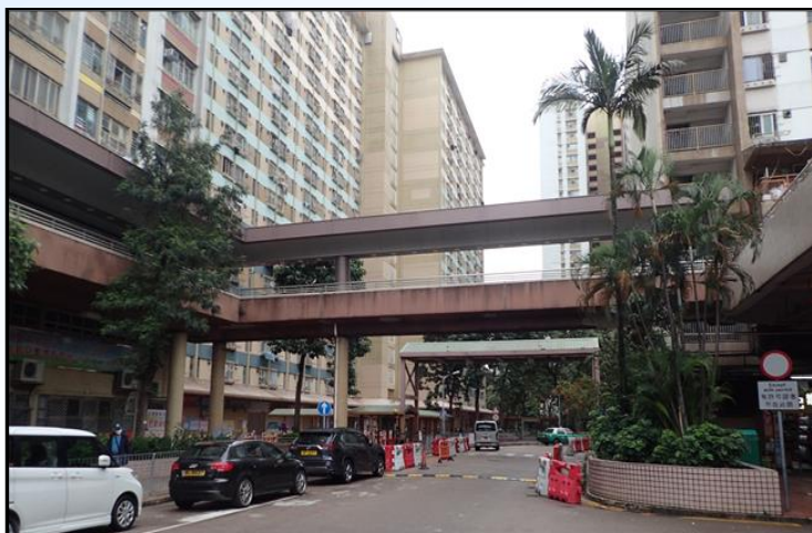
CY06-橫跨現有道路連接彩園邨彩珠樓 及彩華樓的行人天橋