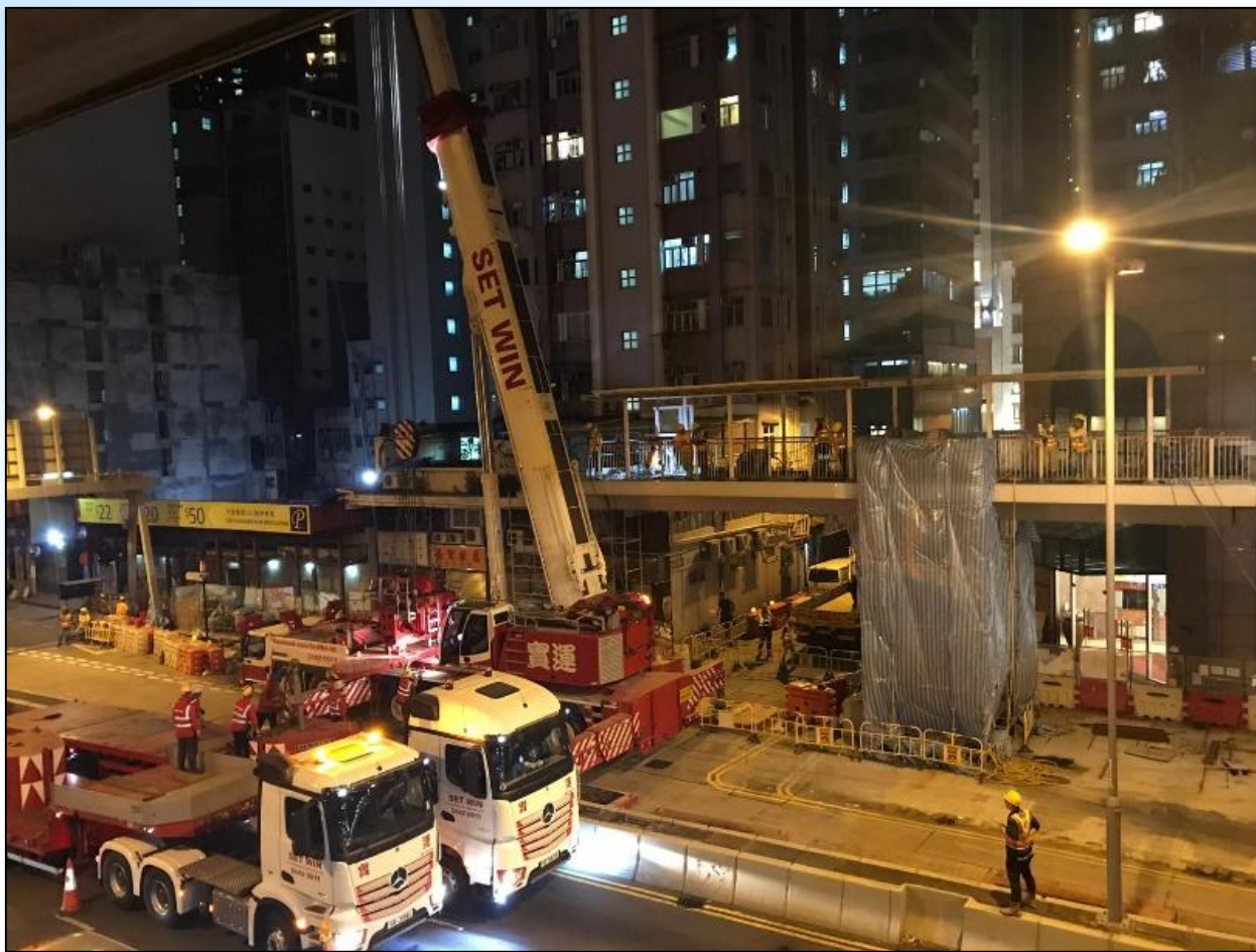
升降機坐落於繁忙的干諾道西旁，晚間拆卸部份天橋