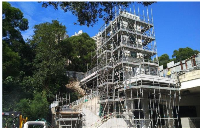
K50-橫跨新清水灣道於 順利邨道的高架行人道