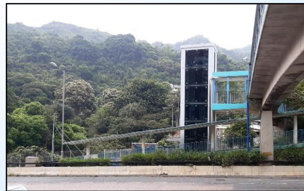
NF74-橫跨獅子山隧道公路近沙田 豐盛苑的行人天橋