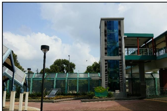
HF92-橫跨東區走廊近 鰂魚涌公園的行人天橋