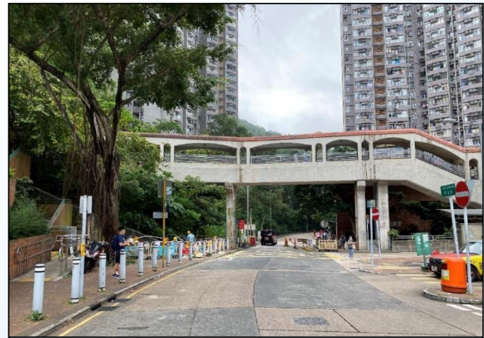
KY01-沙田區橫跨現有道路連接 廣源商場及廣林苑的行人天橋