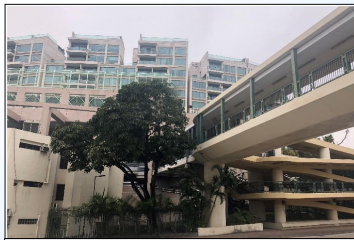
KC01 –橫跨聯合道近聯福道的行人天橋