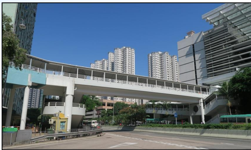
HF138 –橫跨小西灣道近巴士總站的行人天橋