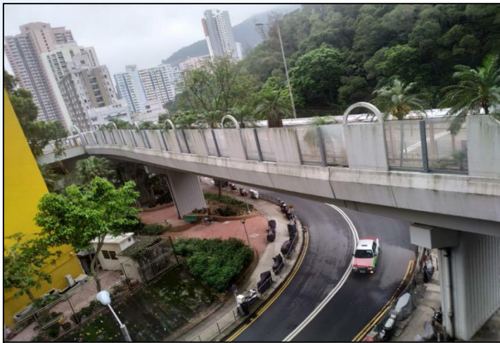
FW01-東區橫跨翡翠道連接 峰華邨峰霞道的高架行人道