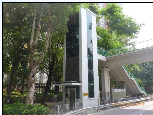
NF76-跨馬會道 近天平邨的行人天橋