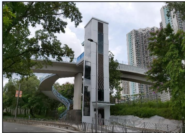
NF104-橫跨粉嶺公路及 新運路的行人天橋