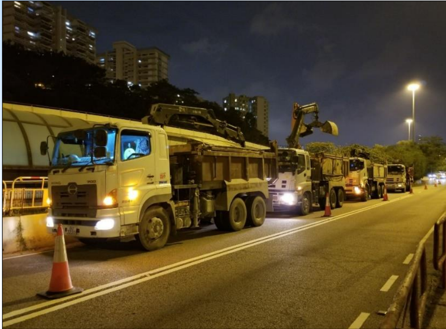
晚間(21:00-06:00)封閉葵涌道快線施工