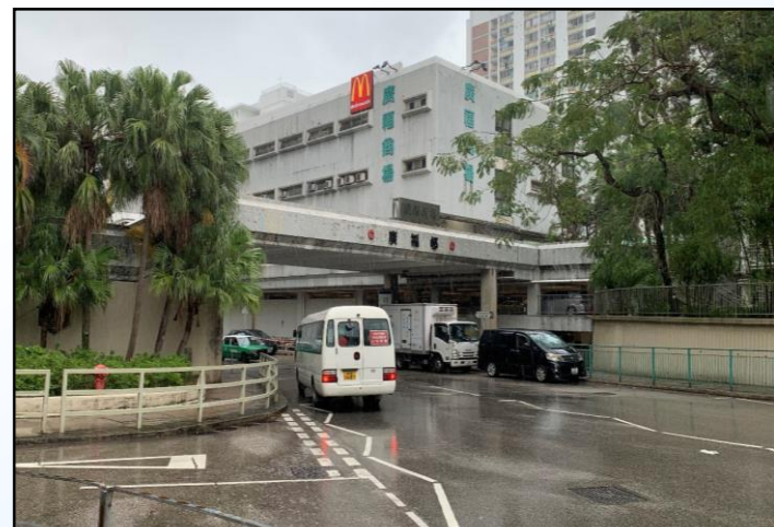
KF02-橫跨寶湖道連接廣福商場 的行人天橋