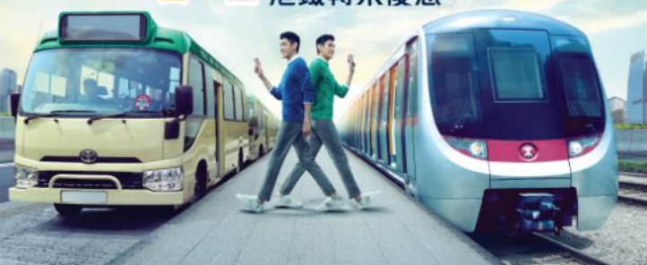
綠色小巴轉乘優惠