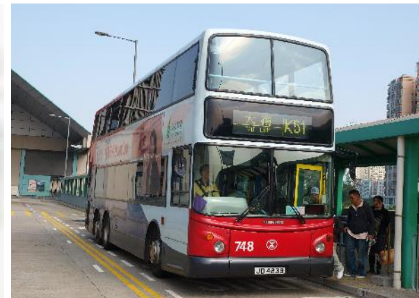
港鐵巴士免費轉乘