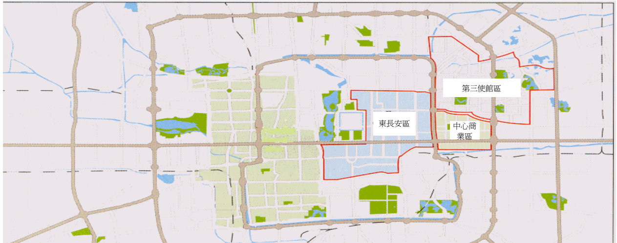
圖 1：北京寫字樓區物業指數