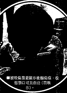
該受傷男童展示後額傷痕，咬傷頸口可見血跡（箭頭指示）。