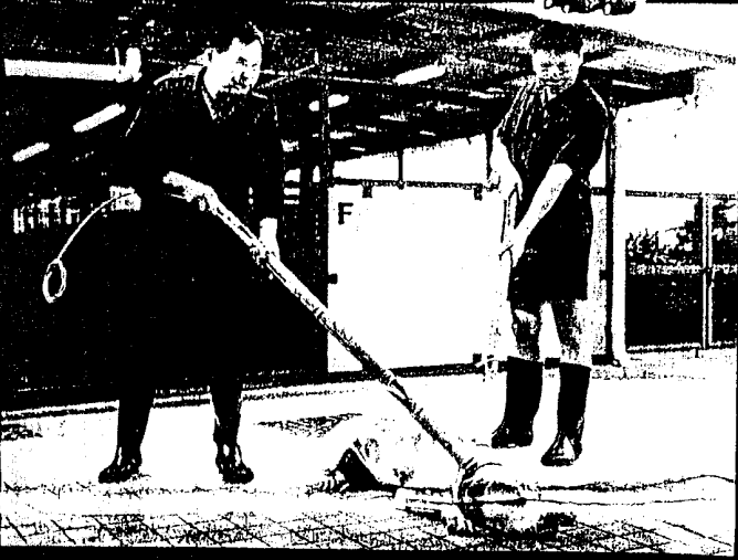
■「BB」則伏於捉狗隊員膝下。