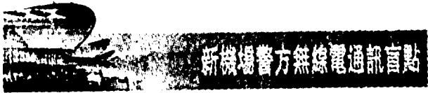
新機場警方無線電通訊盲點