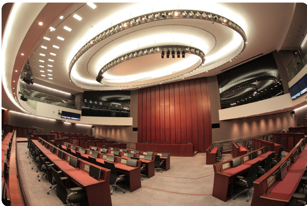
財務委員會及內務委員會的會議通常於會議室1舉行

議員個人利益監察委員會 —— 議員個人利益監察委員會研究《議員個人利益登記冊》的編製、備存及取覽等各項安排，並考慮及調查與議員個人利益的登記及申報有關的投訴，以及與議員申請發還工作開支或申請預支營運資金的行為有關的投訴。委員會亦考慮關乎議員以其議員身份所作行為的操守標準事宜，以及就該等事宜提供意見及發出指引等。