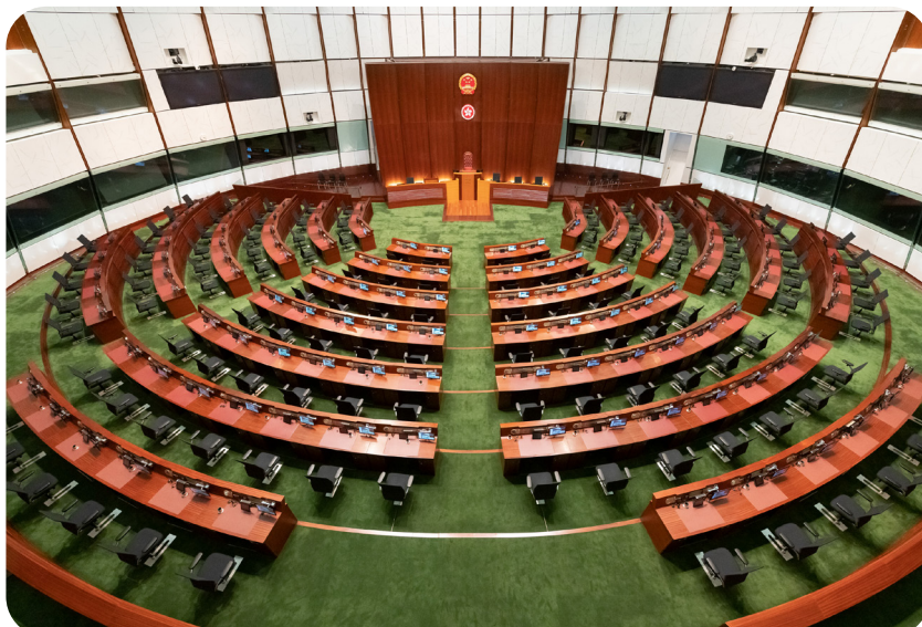
立法會會議在立法會會議廳舉行