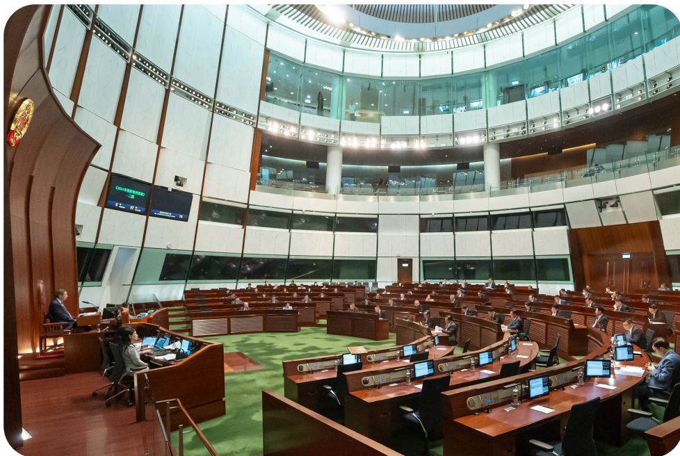
議員於立法會會議席上就撥款法案發言

財政司司長在財政預算案演辭中提出的收入建議，會分別以條例草案或附屬法例的形式提交，供立法會審議。為保障公共收入，行政長官有權作出公共收入保障命令，使須在宣讀預算案當日或有關的賦權法例制定前生效的收入建議（例如增加煙草稅的收入建議），可即時生效。如有需要，立法會可成立法案委員會及小組委員會審議有關收入的建議。