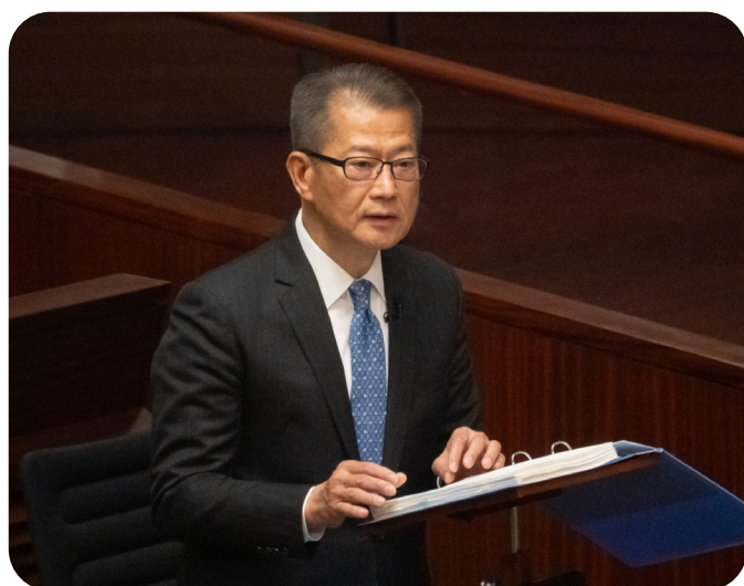
財政司司長陳茂波先生在立法會會議上發表財政預算案演辭

各局局長會帶同其政策範疇內的管制人員出席財委會特別會議，扼要說明其政策範疇內的最新發展及變化、來年的主要工作和在開支預算提出的資源需求。在特別會議舉行前，財委會委員會就直接與開支預算有關的事項以書面提出問題，及在特別會議上跟進當局就書面問題給予的答覆。在特別會議後，財委會主席會向立法會提交報告。