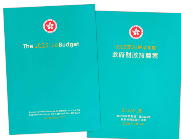
2025至26財政年度政府財政預算案