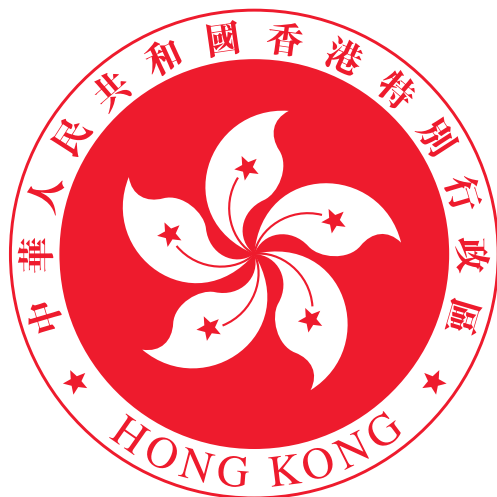
香港特別行政區區徽圖案