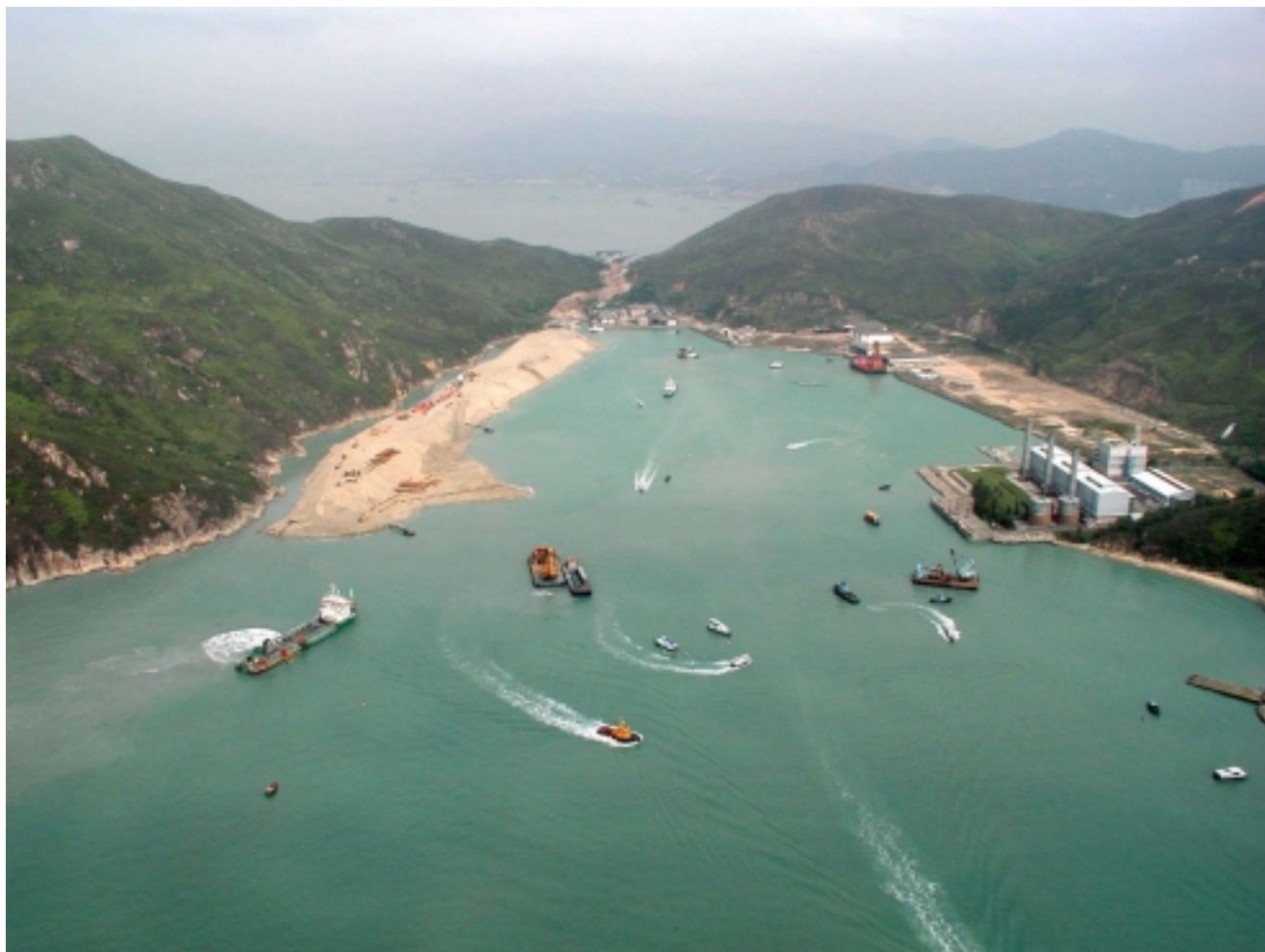
Penny's Bay Reclamation Stage 1 Works (Progress at end March, 2001)