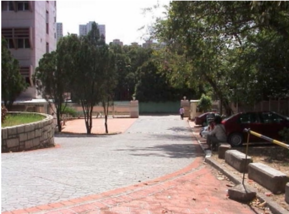
粉嶺醫院正門入口