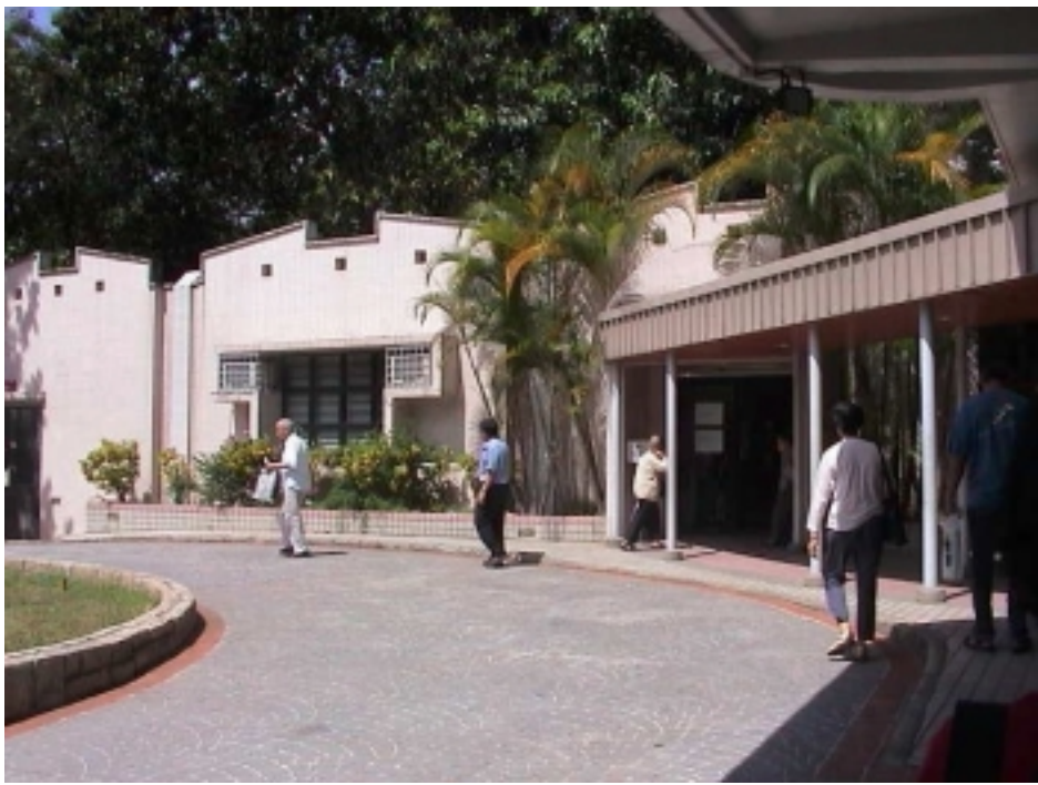
粉嶺醫院藥房延伸部分