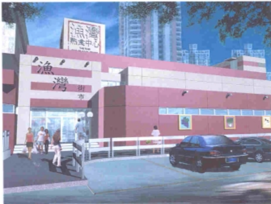
漁灣街市及熟食中心電腦效果图(外觀) COMPUTER RENDERING DRAWING FOR YUE WAN MARKET AND COOKED FOOD CENTRE (EXTERNAL)