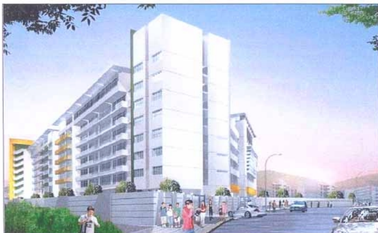
電腦繪製的小學模擬圖（東南面）