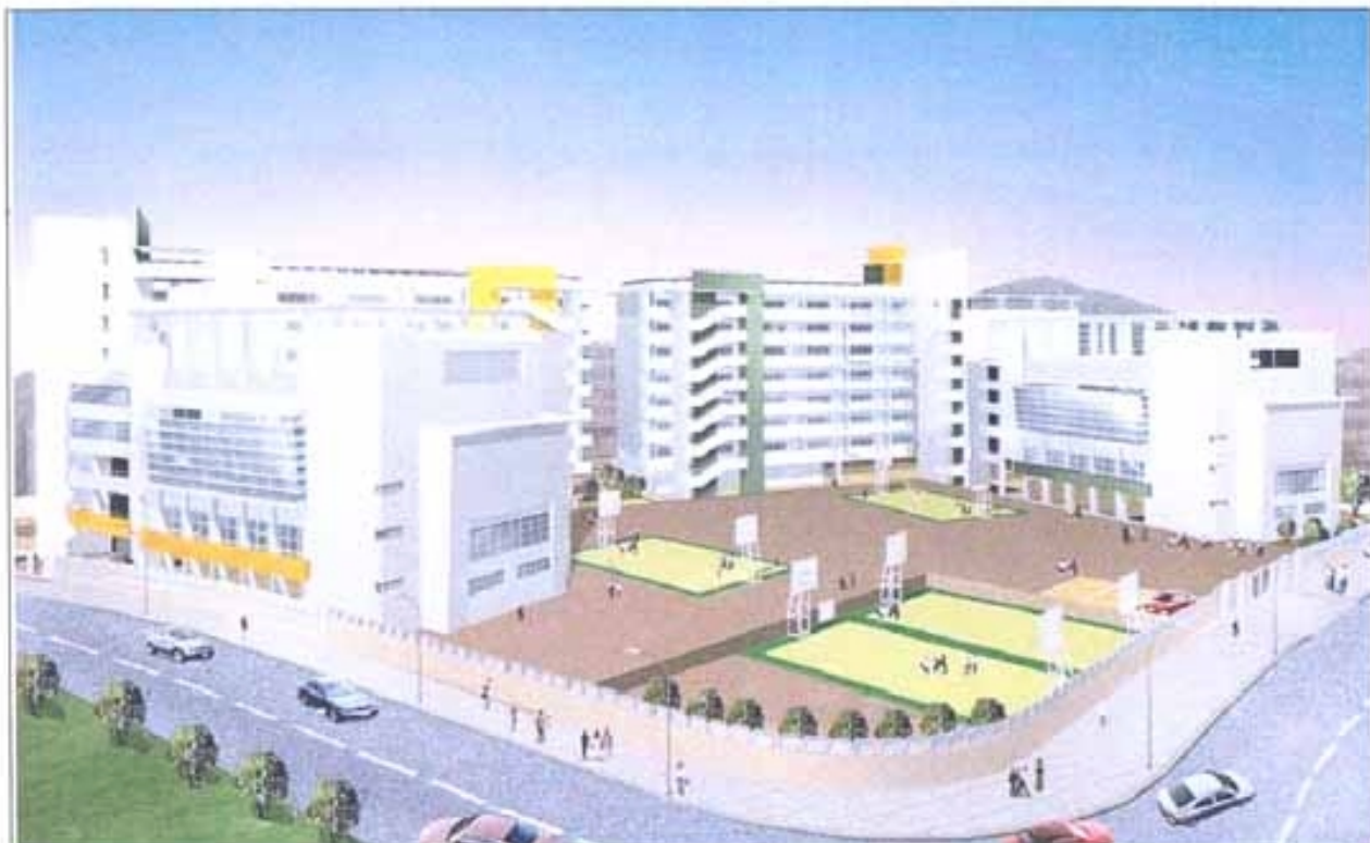
電腦繪製的工地模擬圖（東北面）