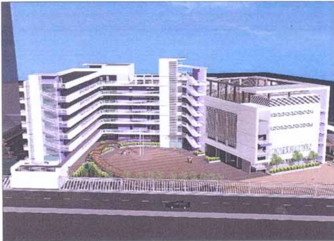
電腦繪製的校舍模擬圖(南面) - COMPUTER RENDERING DRAWING OF THE SCHOOL PREMISES (SOUTHERN VIEW)