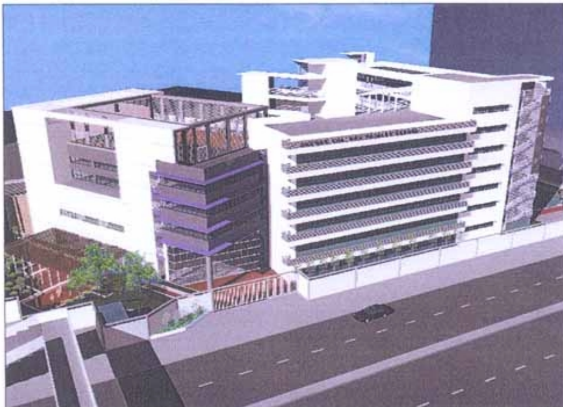
電腦繪製的校舍模擬圖(北面) - COMPUTER RENDERING DRAWING OF THE SCHOOL PREMISES (NORTHERN VIEW)