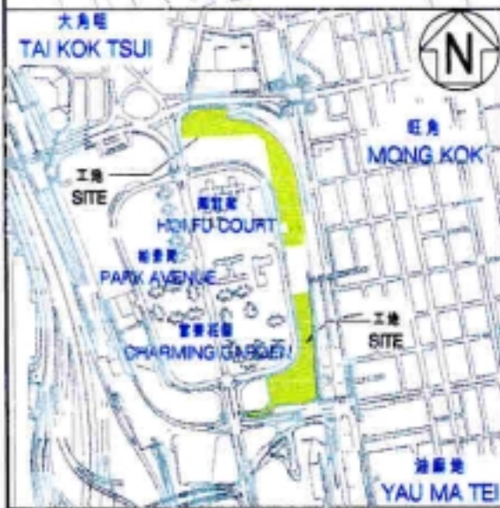
位置圖 LOCATION PLAN 比例 SCALE 1:15000