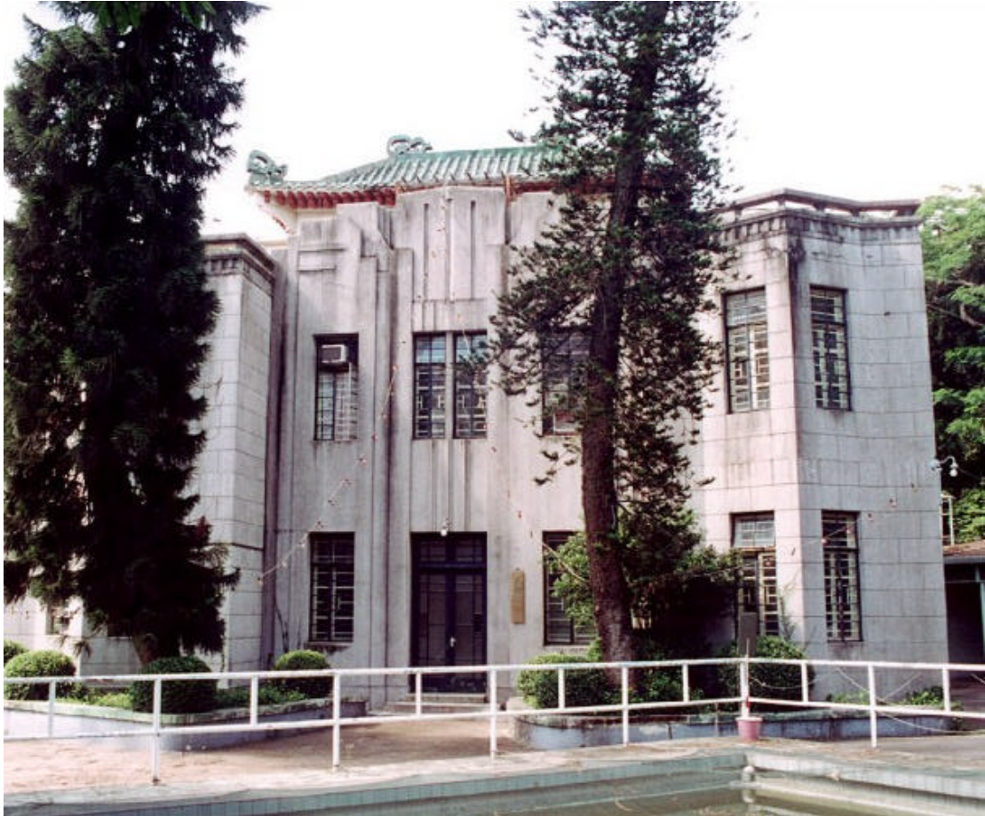
馬禮遜樓（前達德學院主樓）

Morrison Building (Main building of the Former Dade Institute)