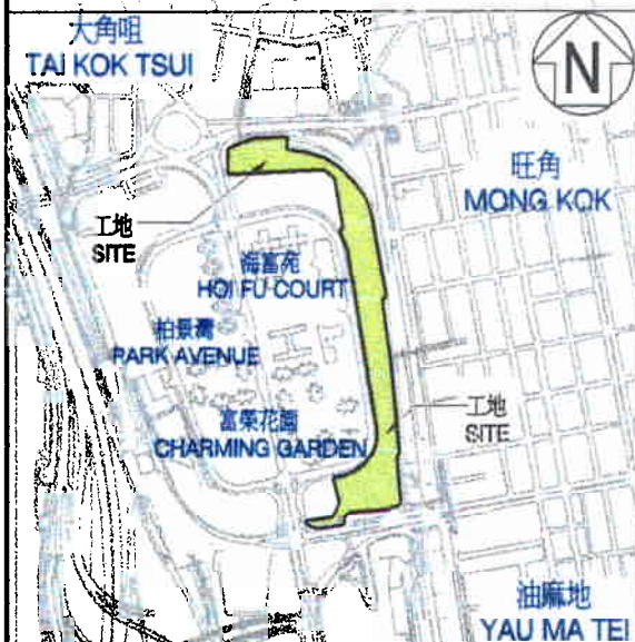
位置圖 LOCATION PLAN 比例 SCALE 1: 15000