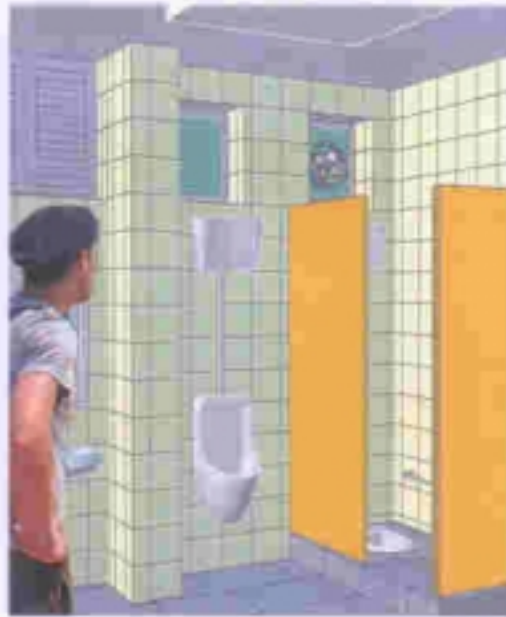
廁所改善後之內觀 INTERIOR VIEW OF TOILET AFTER IMPROVEMENT