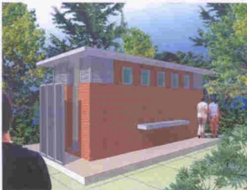
廁所改善後之外觀 EXTERIOR VIEW OF TOILET AFTER IMPROVEMENT