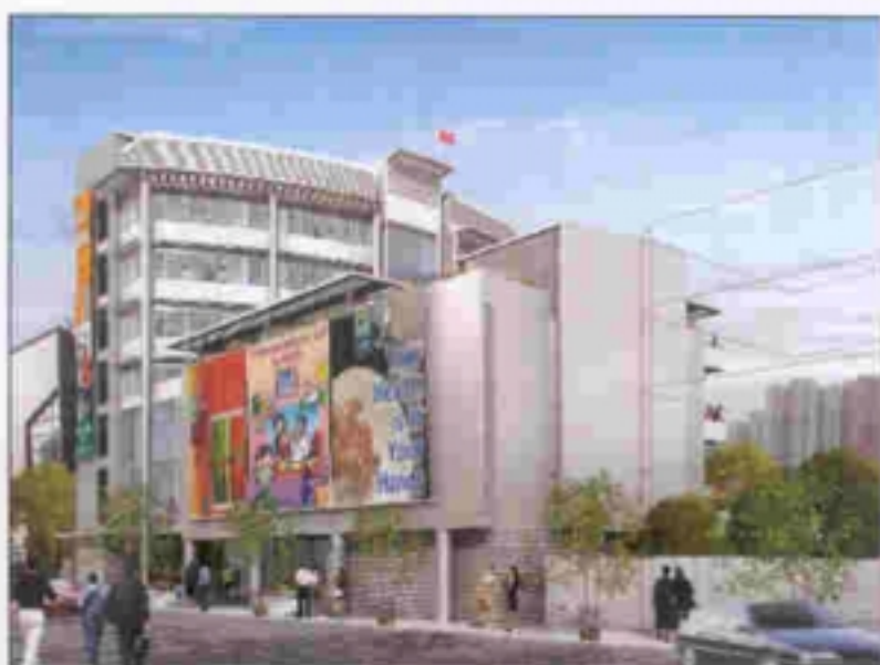
從西南面望向建築物的構思圖 VIEW OF BUILDING FROM SOUTH-WESTERN DIRECTION (ARTIST'S IMPRESSION)

WTSC 屯門井財街 政府聯用大樓 JOINT USER COMPLEX AT TSENG CHI STREET, TUEN MUN