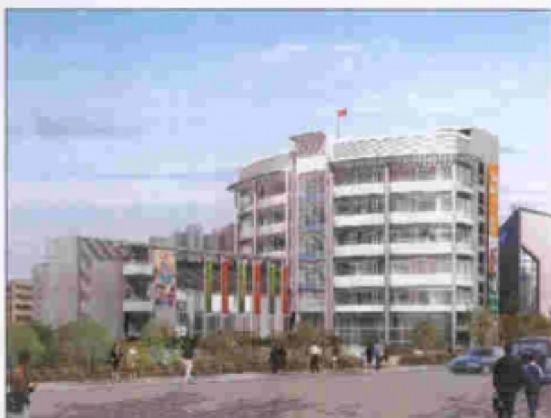
從東南面望向建築物的構思圖 VIEW OF BUILDING FROM SOUTH-EASTERN DIRECTION (ARTIST'S IMPRESSION)