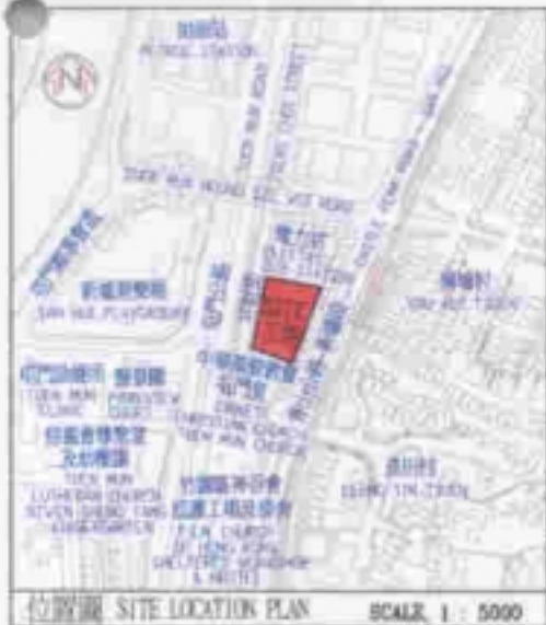
位置圖 SITE LOCATION PLAN SCALE: 1 : 5000