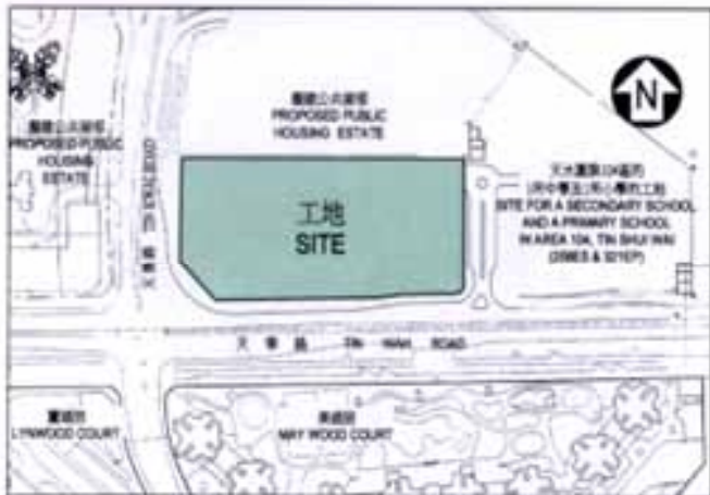
位置圖 LOCATION PLAN