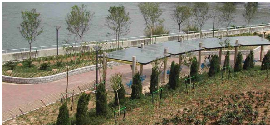
東涌 52 區園景美化工程

綠化工作範疇廣泛，包括以綠化、保育和環保方法來改善居住環境的工作。政府現已制定政策，強調綠化工作的重要，並會調撥資源，加強在公眾地方的綠化工作。