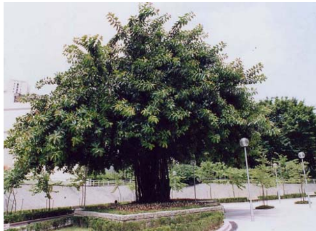
大興邨的印度橡樹