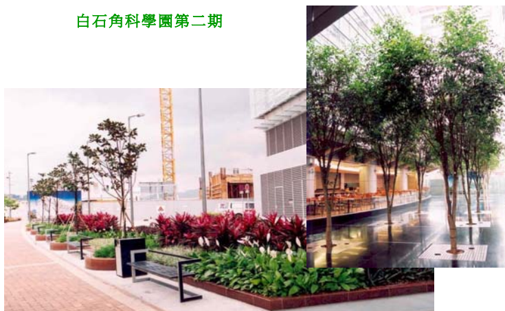
白石角科學園第二期

我們會努力廣種花草樹木，並加以妥善護理和保育，藉以改善居住環境。當前的目標是要令市區的綠化地帶顯著增加，提升現有綠化區的質素，並在公共工程項目的規劃及發展階段，盡量爭取綠化的機會。