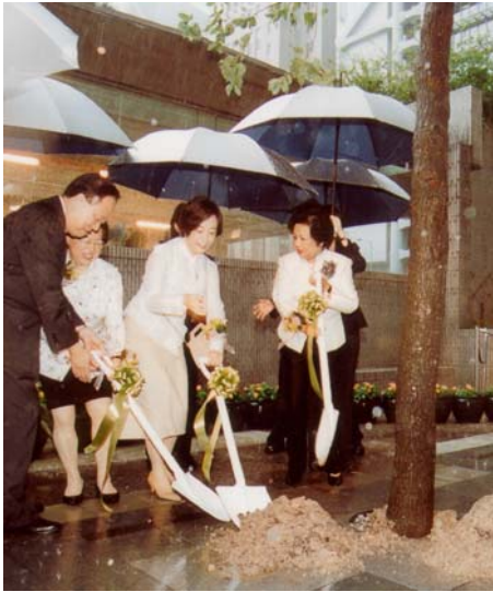
「中區環境改善項目」 的首項活動： 植樹典禮