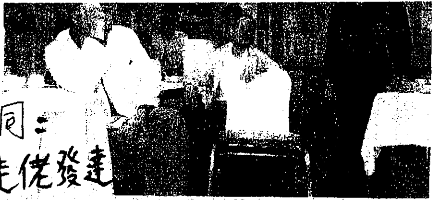
無奈 雖然本港經濟環境已逐步改善，但位於美孚的新喜海鮮酒家昨日突然結業，被僱主拖欠薪金的員工，均顯得十分無奈。