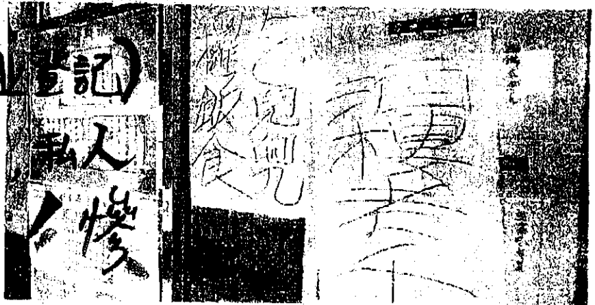
酒樓老干 酒樓僱主突然失蹤，被拖欠薪金的員工，在店門貼上「酒樓老干，乞兒兜搵飯食」的大字報。