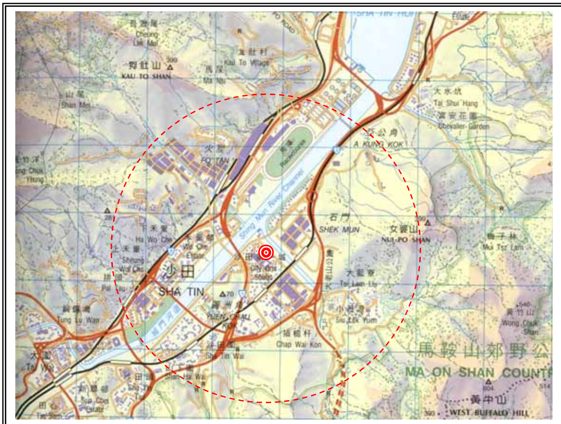
沙田第一城兩公里半徑範圍圖示(假設日本腦炎患者居於此)(地圖比例: 1:50 000)