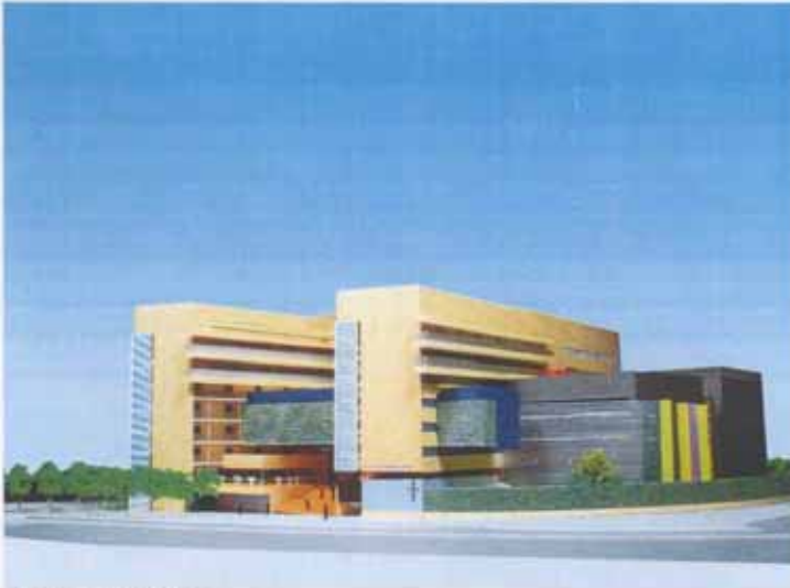
從西南面望校舍的構思圖 VIEW OF THE SCHOOL PREMISES FROM SOUTH WESTERN DIRECTION (ARTIST'S IMPRESSION)