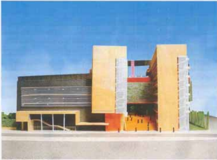
從東面望校舍的構思圖 VIEW OF THE SCHOOL PREMISES FROM EASTERN DIRECTION (ARTIST'S IMPRESSION)