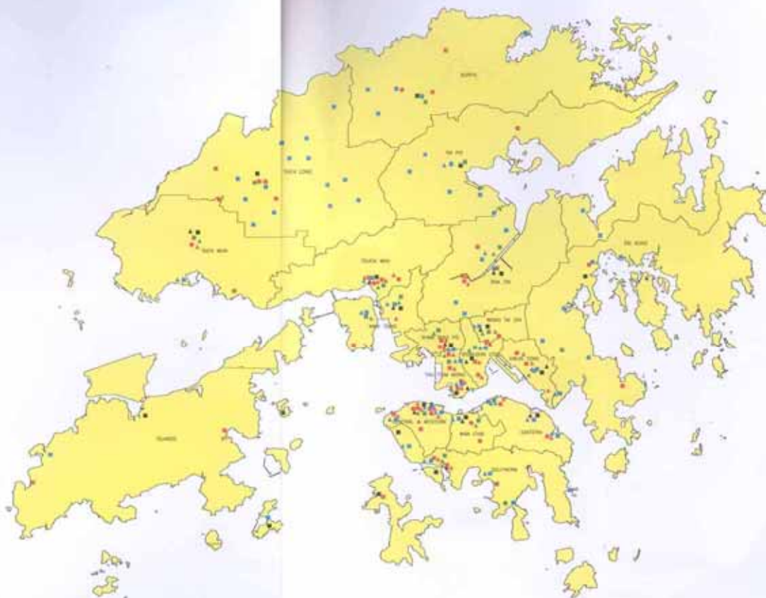
更換及修復水管工程——更換及修復水管的位置圖 Replacement and Rehabilitation of Water Mains —— Location of water mains to be replaced/rehabilitated