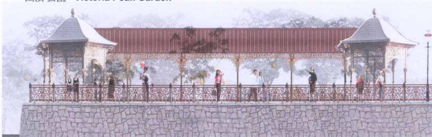
維多利亞式的花園