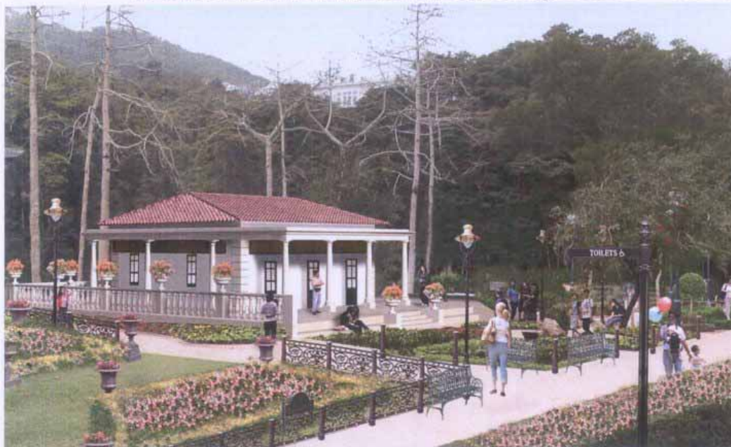
柯士甸山遊樂場的建築物及設施 Structure and Street Furniture in Mount Austin Playground