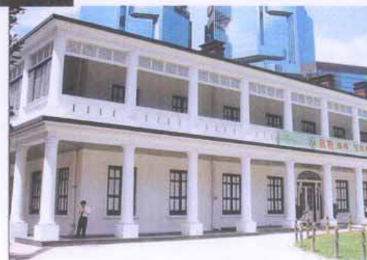
維多利亞式的建築物 - 茶具文物館 Victorian style building – Flagstaff House Museum of Tea Ware