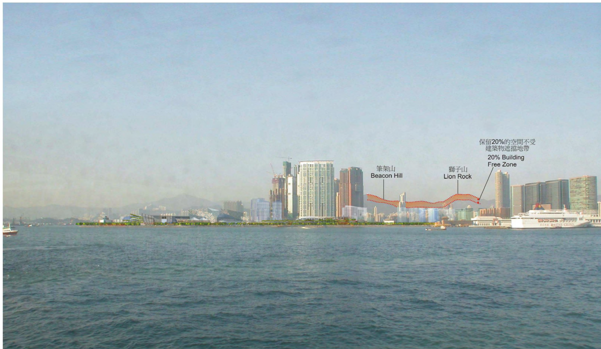
西九文化區 從中環天星碼頭遠眺的全景 WEST KOWLOON CULTURAL DISTRICT VIEW FROM CENTRAL STAR FERRY PIER