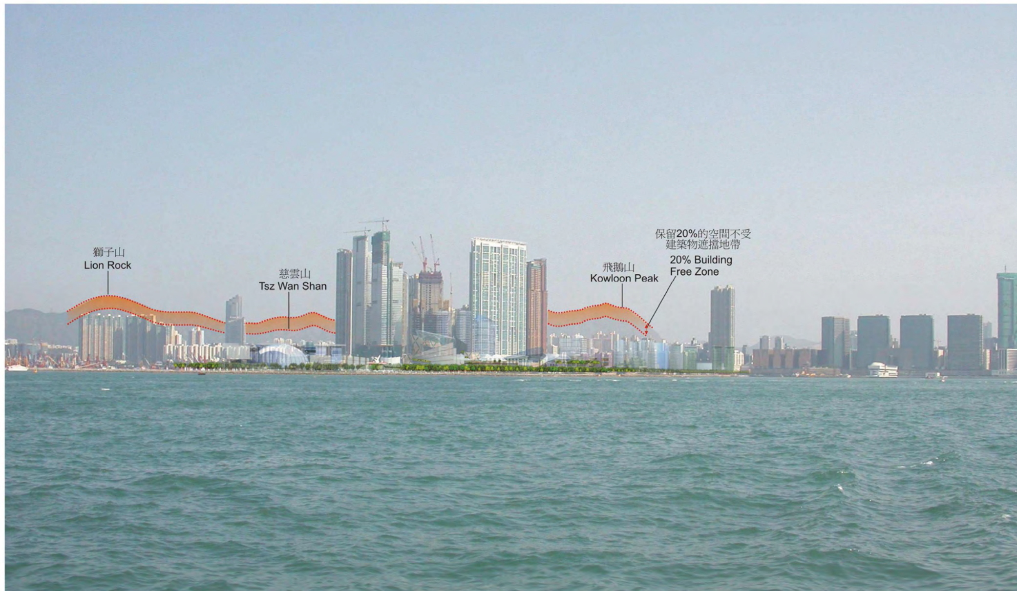
西九文化區 從中山紀念公園遠眺的全景 WEST KOWLOON CULTURAL DISTRICT VIEW FROM SUN YAT SEN MEMORIAL PARK