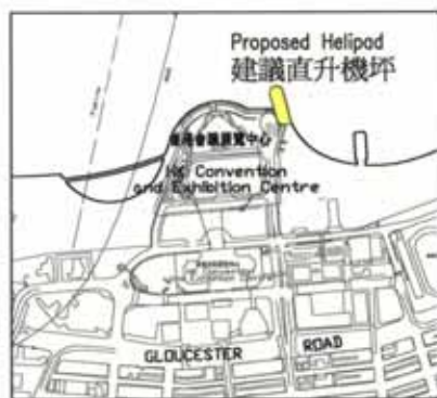
KEY PLAN NOT TO SCALE