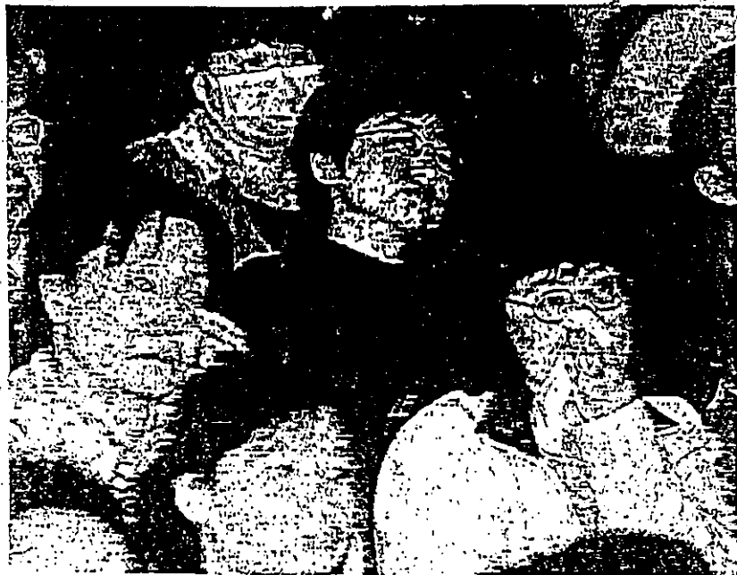
多名出席特殊教育諮詢大會的家長，談到擔心智障子女被排斥於新學制下，不禁潸然下淚。

教統局資料顯示，目前六十二所特殊學校中，四十八所已在中三以後，提供兩年三年教育。