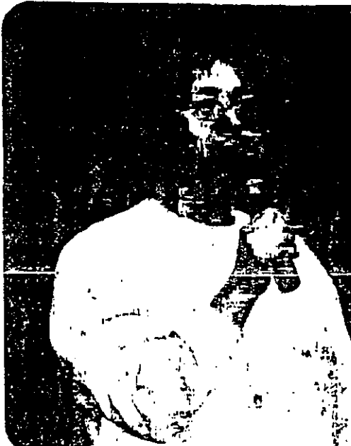
一名特殊學童家長在會上表示，她四歲的女兒讀完中三後不能升學，須轉讀職業訓練局的技能訓練中心，她形容只有幼稚程度商的她須學技能去做「打工」。

教育統籌局局長李卓人回應指，由於特殊學校的學生需要特殊處理，故在諮詢文件中只是簡略交代，當局已與特殊教育代表會面，照顧特殊學生亦要跟隨新學制，從今年下半年開始，相信有關方面會歡迎新學制。