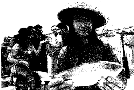
無言天地劇團劇目鬆綁快、好世界之劇照

member of HONG KONG COUNCIL OF SOCIAL SERVICE