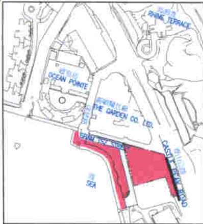
位置圖 LOCATION PLAN 比例 1 : 6000